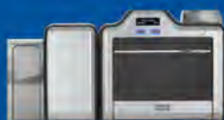
Oboustranná tiskárna / kodér

Společnost HID Global představila technologii High Definition Printing (HDP) již v roce 1999 a od té doby ji neustále zdokonaluje. HDP5600 reflektuje závazek zákazníkem - inspirované inovace a vývoj řešení řady HDP. Spolehlivá a odolná tiskárna již 5. generace, nabízí tiskovou kvalitu a technologická vylepšení, které můžete jen ocenit. Navíc její spolehlivost Vám přináší více klidu a méně prostojů - a protože tisková hlava nikdy nepřijde do kontaktu s povrchem karty nebo nečistotami, nebude nikdy poškozena během tiskového procesu. Výrobce na ni poskytuje doživotní záruku.